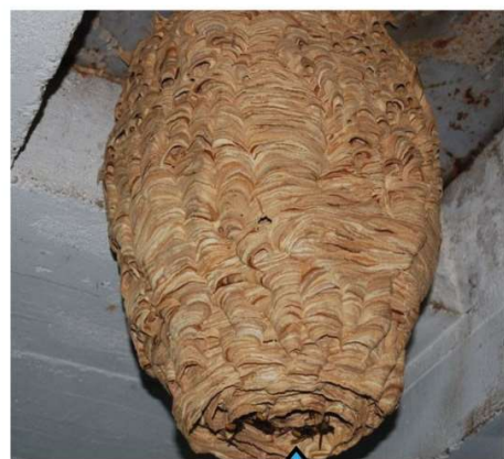
Trou d'entrée du nid au dessous