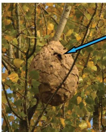
Trou d'entrée du nid sur le côté